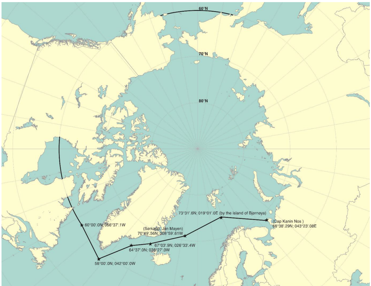
Figura 2: extensión máxima del ámbito de aplicación en aguas árticas