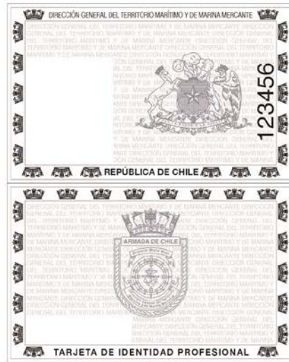
D.G.T.M. - 624 Ordinario NSL 7530 - N01 - 0597 2001