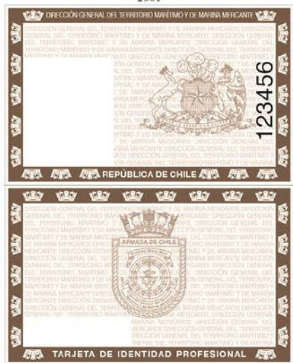
D.G.T.M. - 625 Ordinario NSL 7530 - N01 - 0598 2002