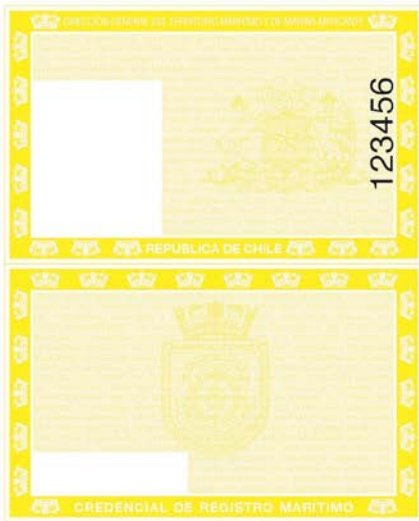
D.G.T.M. - 621 Ordinario NSL 7530 - N01 - 0539 2001