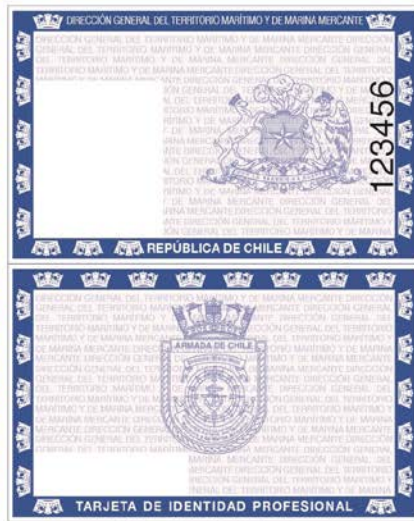
D.G.T.M. - 623 Ordinario NSL 7530 - N01 - 0596 2001