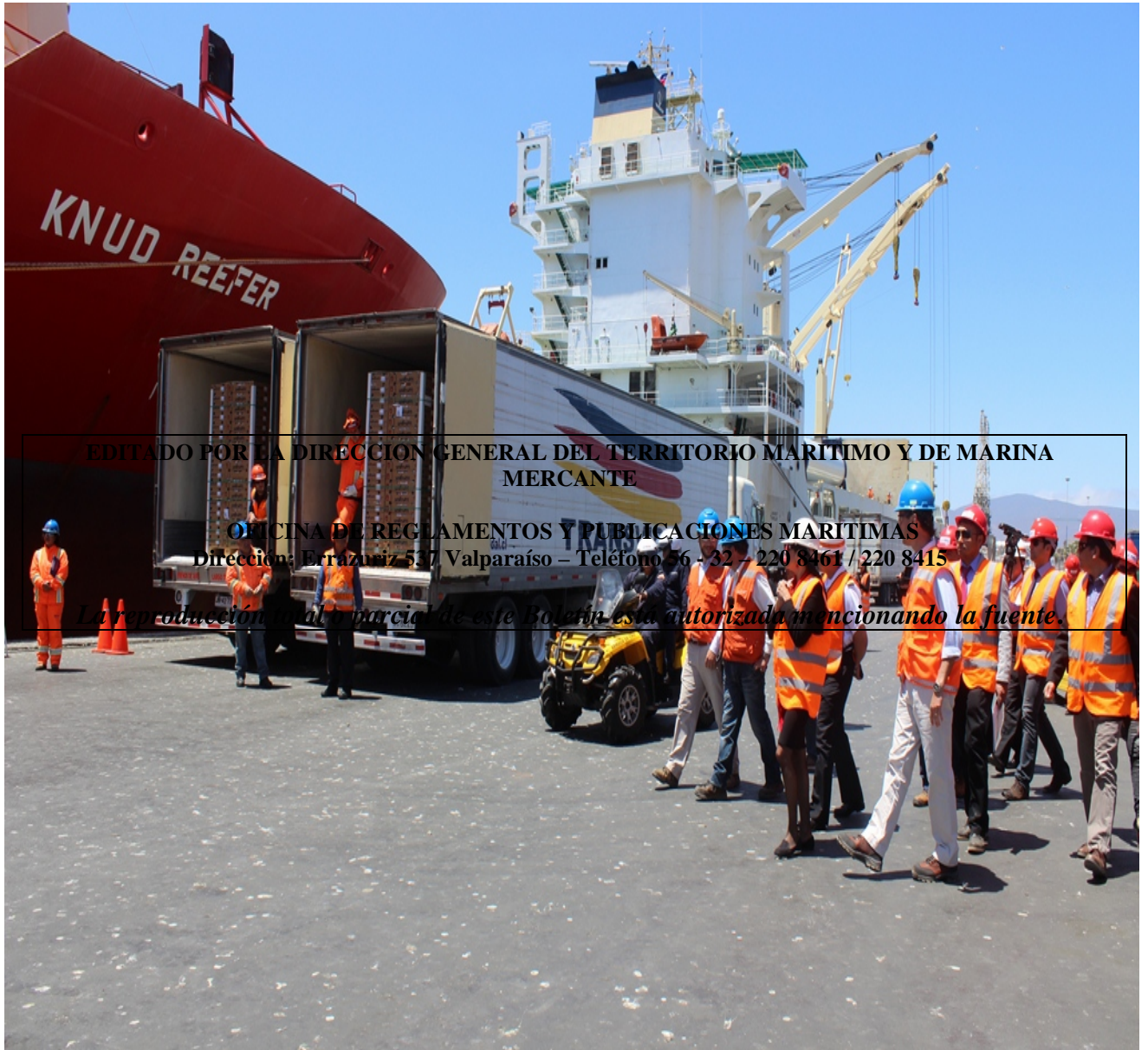
Puerto de Coquimbo – Embarque de Exportaciones.