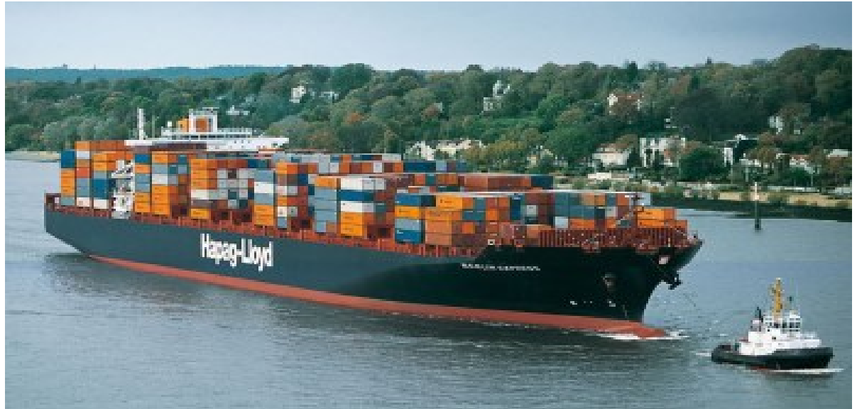
Transporte de Contenedores