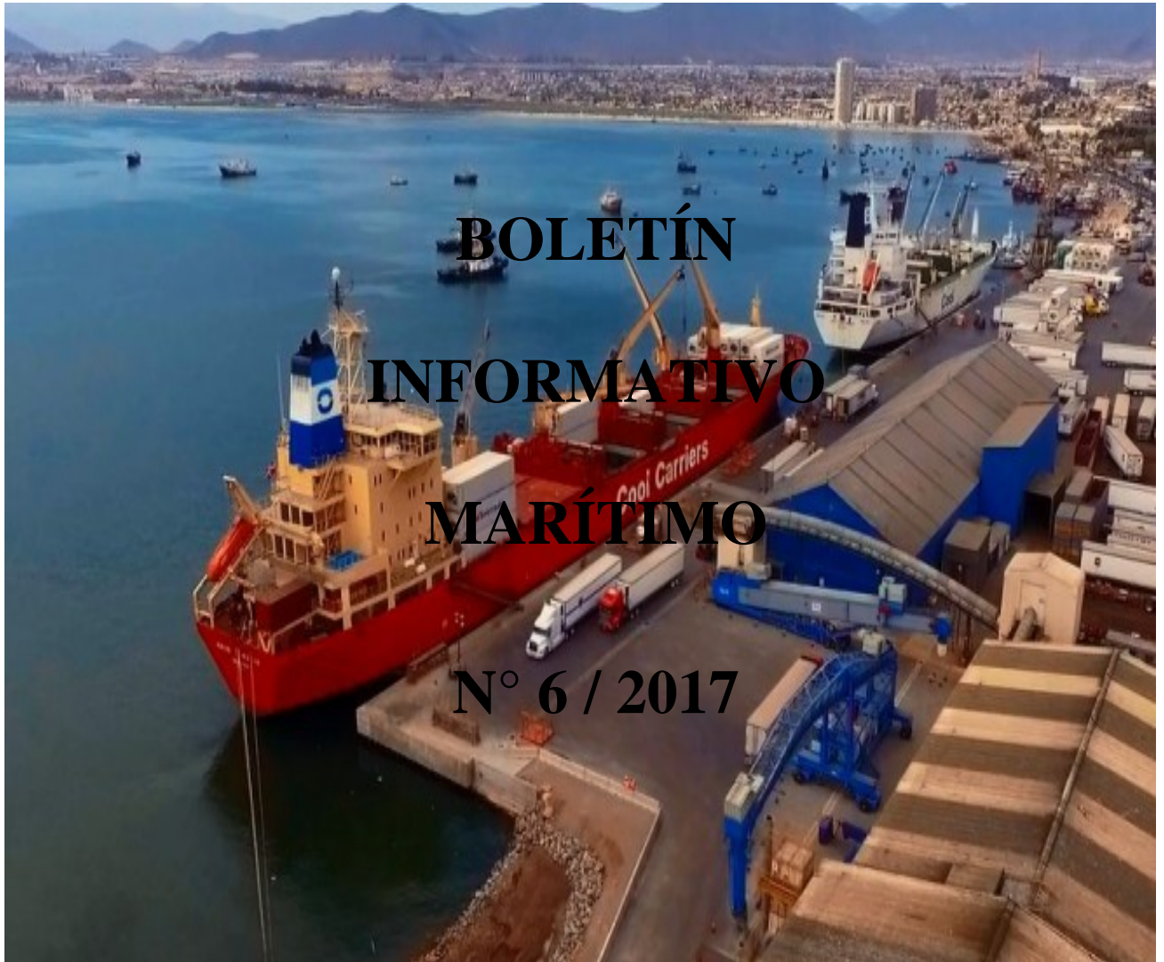
Puerto de Coquimbo