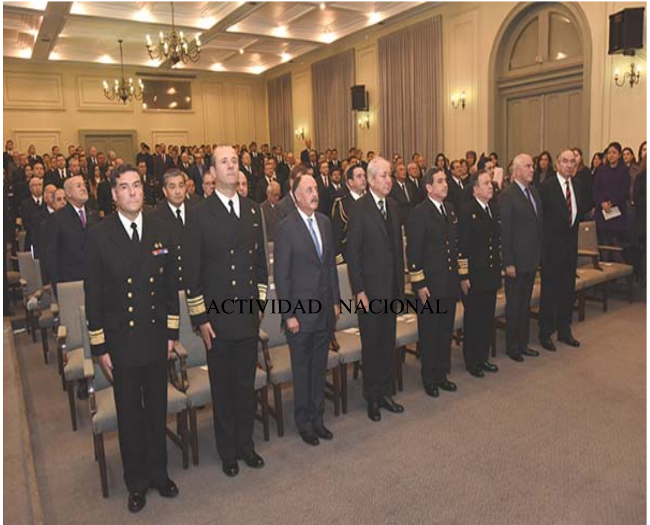
DIRECTEMAR – Commemoración 199 Aniversario de la Marina Mercante Nacional.