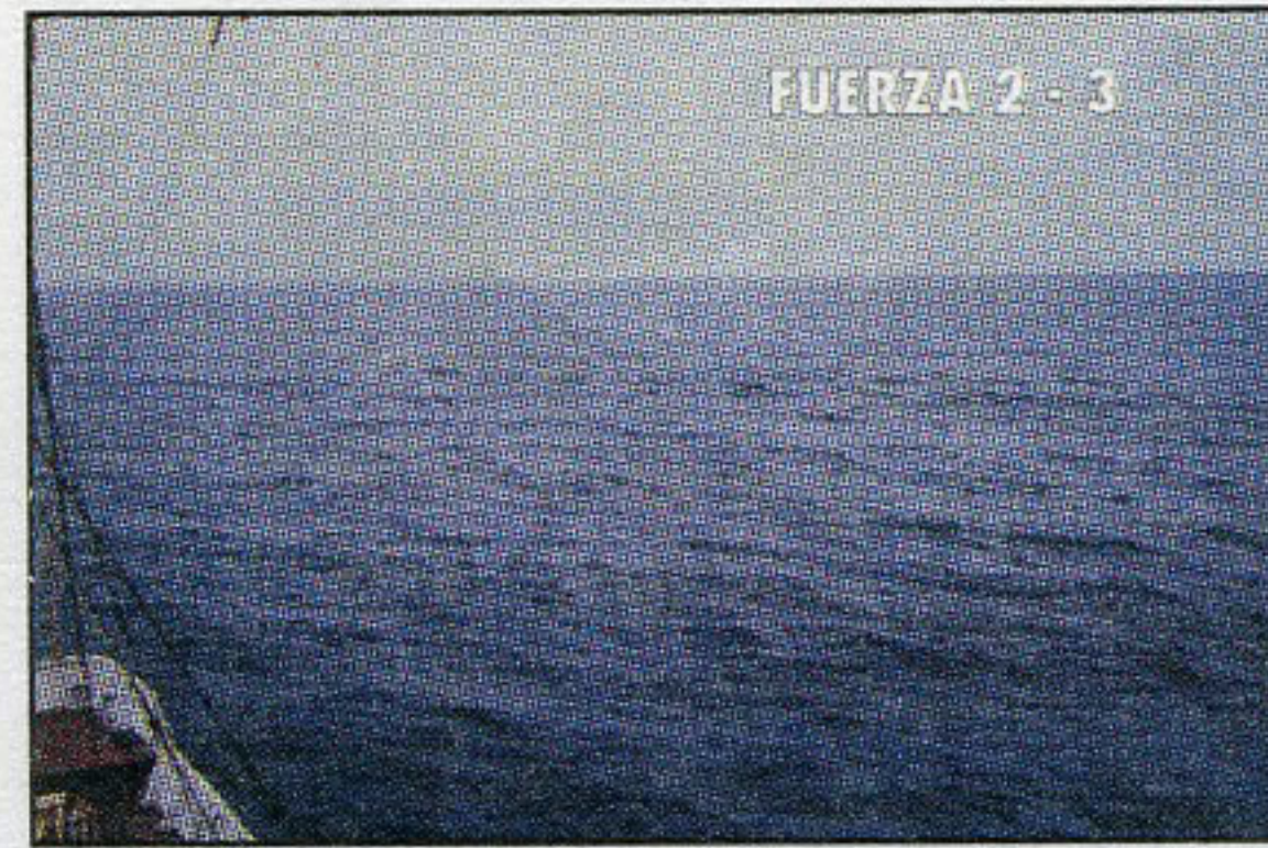
FUERZA 2 - 3

FUERZA 1 : Viento 1-3 nudos. Aspecto del mar : Pequeños rizos con apariencia de escala. Crestas sin espuma. Altura de la ola : 0,1 m Estado del mar : Llana