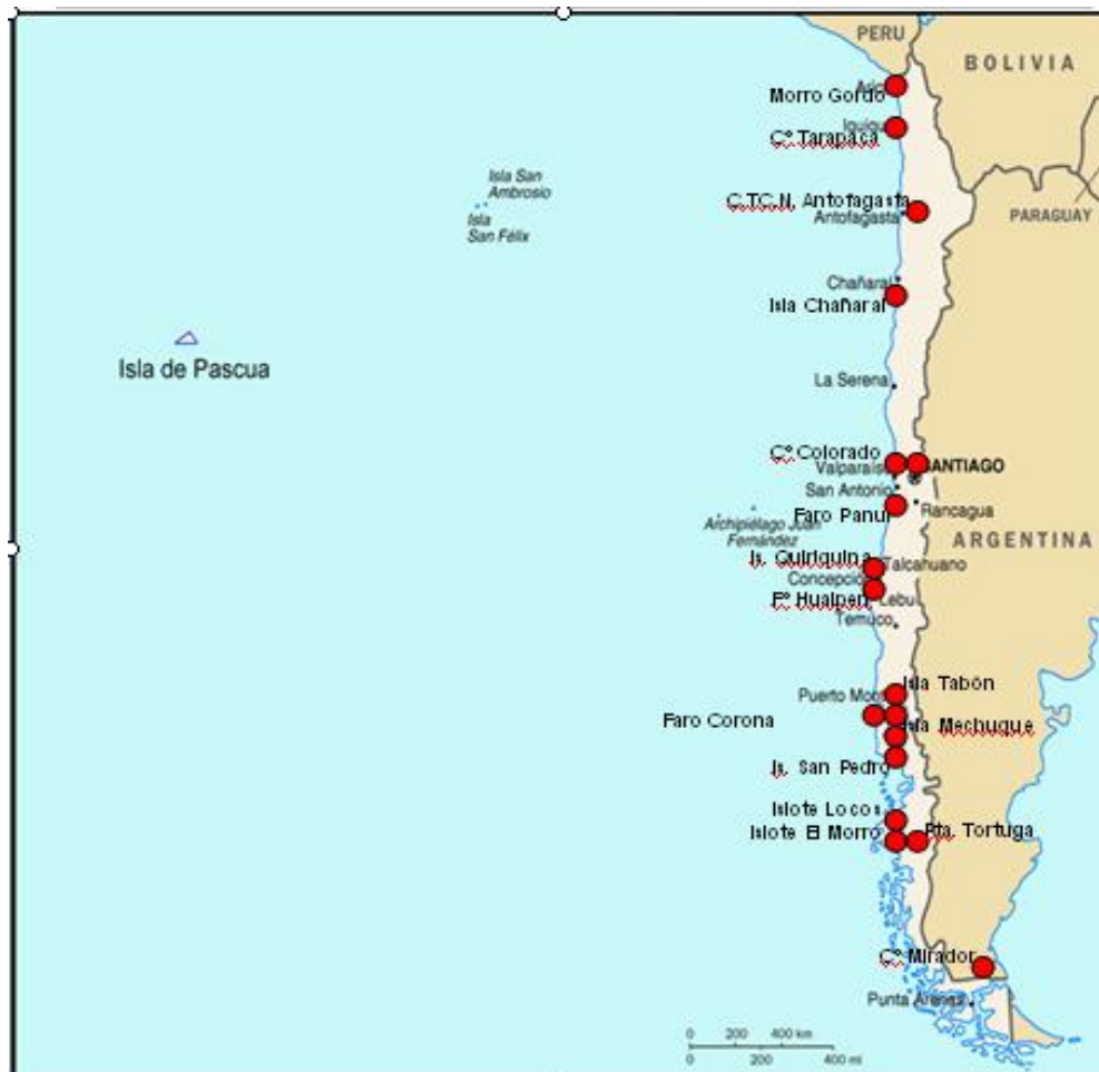
Figura N° 7